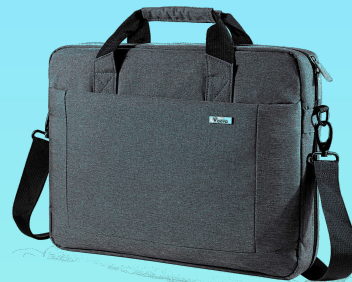
Sacoche Voova 15.6 Pouces 31,99€