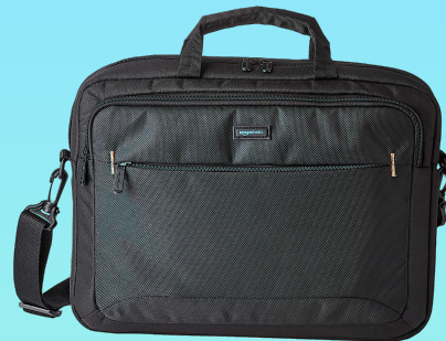
Sacoche Amazon Basics 15,55€