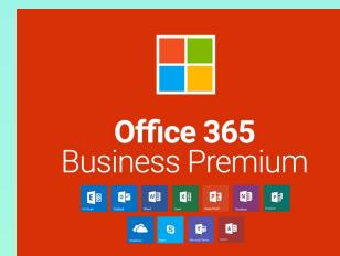
Microsoft Office 365 Business Premium 16,90 € HT/mois