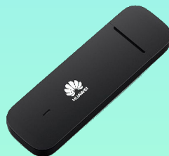
Clé 4g HUAWEI Dongle 30€