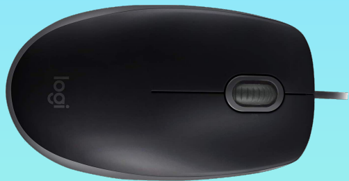
Logitech B110 9,98€