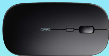
Souris sans Fil Rechargeable Inphic Mini 13,99€