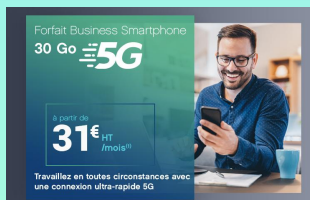
Abonnement Coriolis 31 € HT/mois