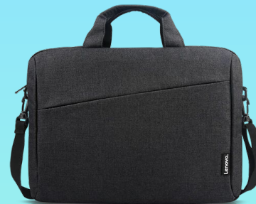
Sacoche Lenovo 15,6 po T210 24,00 €