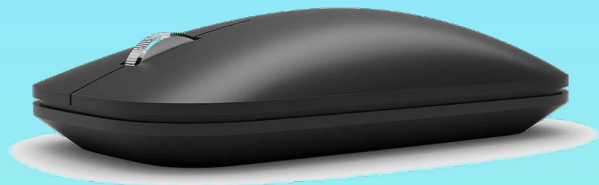
Microsoft Modern Mobile Mouse 35,99€